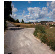
Cruilla de camins