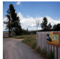
Plans de Sant Genís