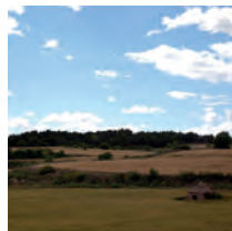
Sant Valentí / Les Brucardes