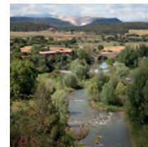
Mirador del Llobregat