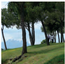
El Bosquet / Sant Fruitós