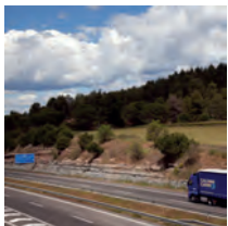
Autopista Terrassa / Manresa