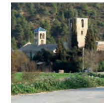
Sant Benet de Bages