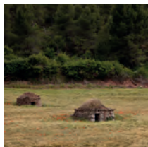
Al peu del Montpeità